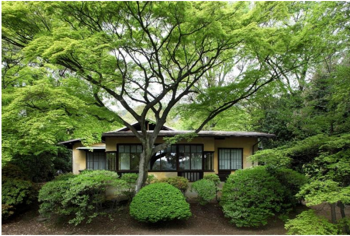
新緑の「聴竹居」外観全景